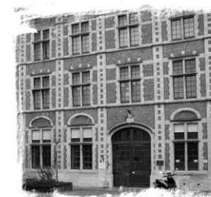
Genealogisch documentatiecentrum "Prinsenhof"